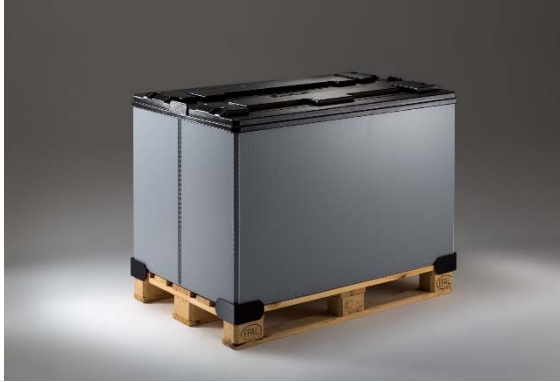
Bild 1: Plug'n Pack-System mit Deckel auf Europalette (plug-n-pack-system.jpg)