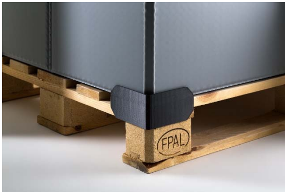
Bild 2: Plug'n Pack-Aufsatzzecken (Außenansicht) (aufsatzzecken-aussenansicht.jpg)